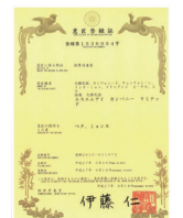
デザイン特許証(日本)