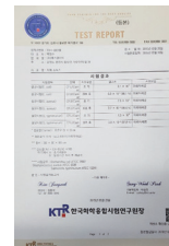
韓国検査機関 証明書