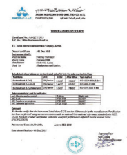
クエート検査機関 証明書