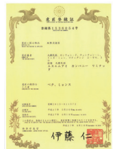
デザイン特許証(日本)

製造元 smi.co.ltd www.m-care.kr / www.엠케어.kr 住所:カンウォンドチュンチョンシトネミョンコドウタンジ2キル30 ホームページ:www.m-care.kr