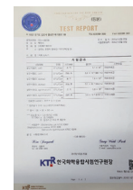
韓国検査機関 証明書