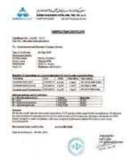
クエート検査機関 証明書