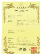
デザイン特許証(日本)

製造元 smi.co.ltd www.m-care.kr / www.엠케어.kr 住所:カンウォンドチュンチョンシトネミョンコドウタンジ2キル30 ホームページ:www.m-care.kr