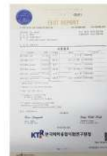
韓国検査機関 証明書