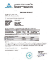
クエート検査機関 証明書